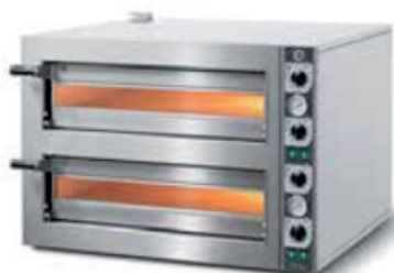
Four Pierrade® 2 étage Capacité totale 54 pierres