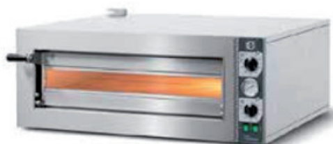
Four Pierrade® 1 étage Capacité totale 27 pierres